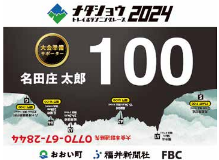
「ボランティア + 出走権」用

ボランティアに来てくれた選手には、長時間に渡るマーキング作業や、荷揚げ作業を手伝っていただきました。多大な労働力を提供いただいています。